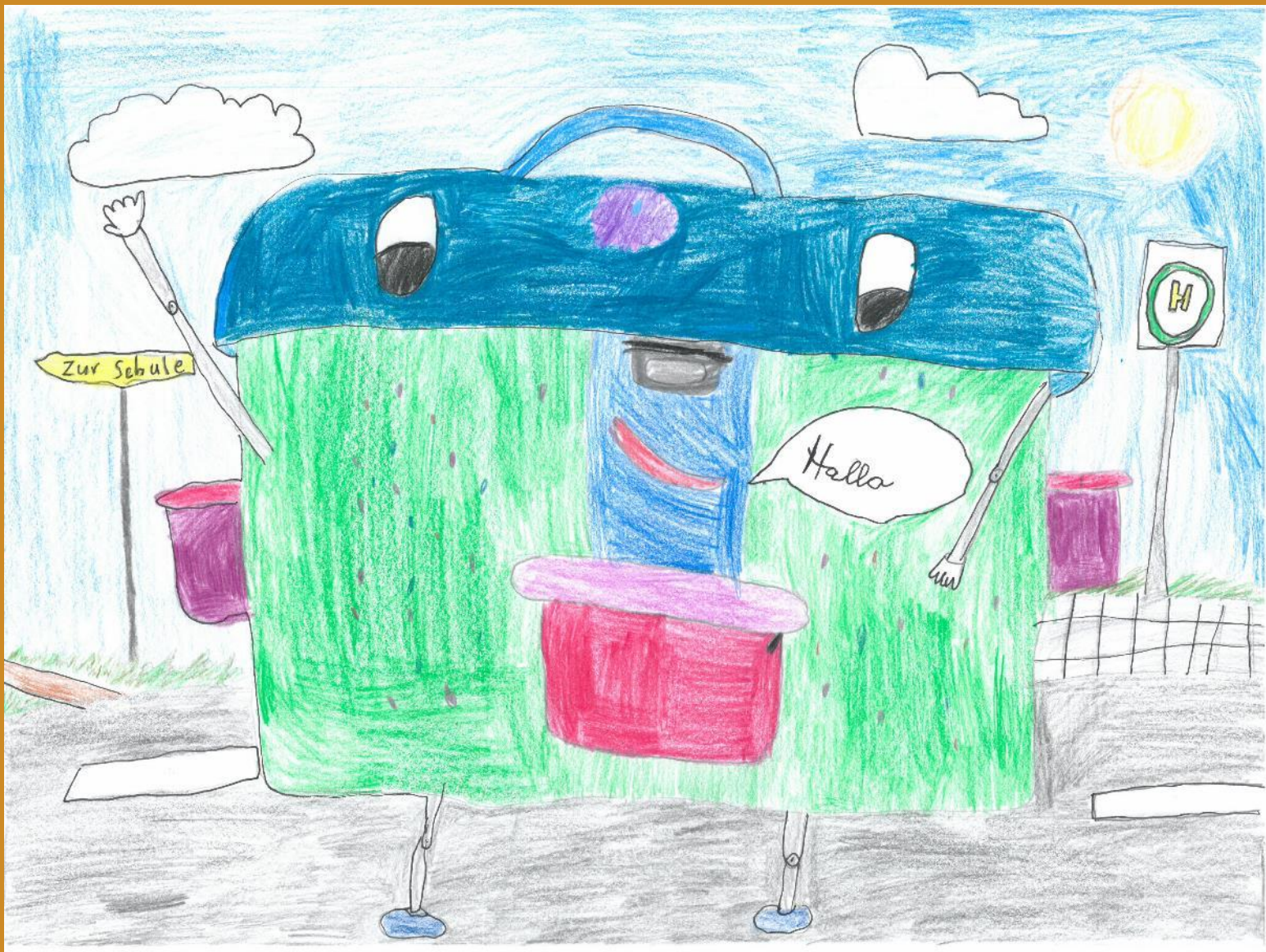
2. Platz: Antonia Buchschachner – „Selbstständige Schultasche geht alleine in die Schule“