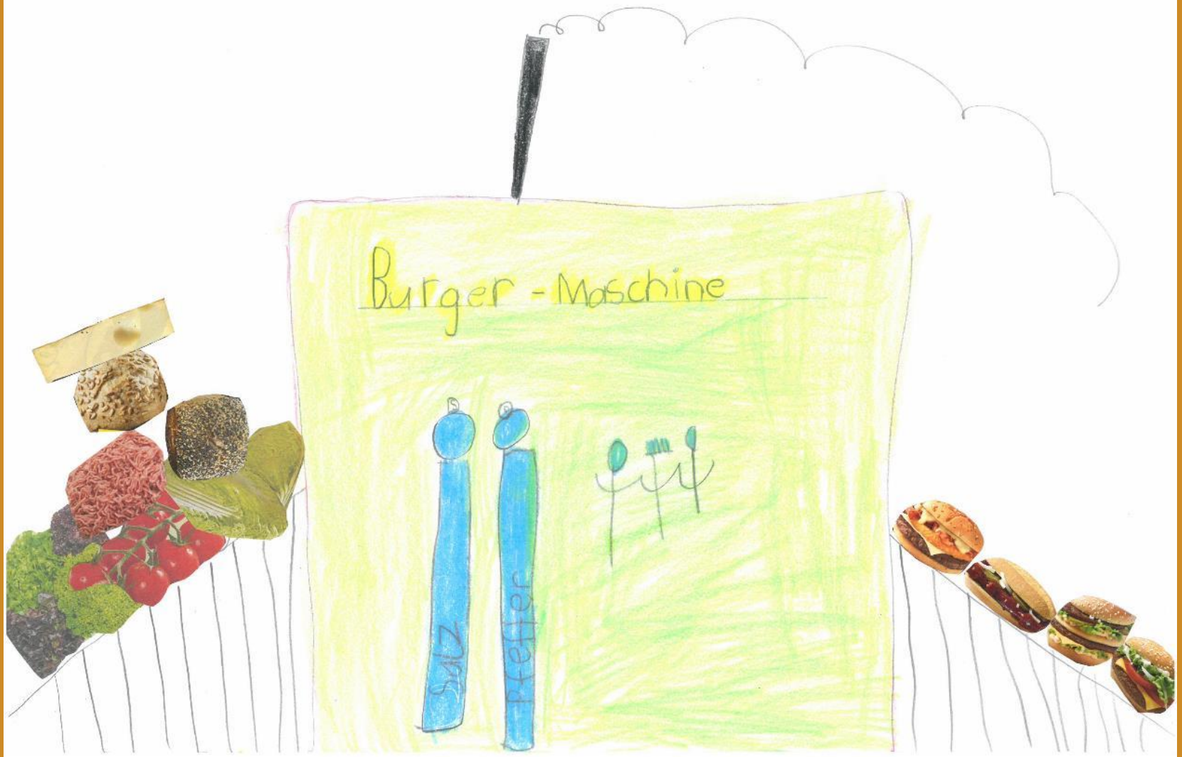
3. Platz: Magdalena Rudholzer - „Burger-Maschine/ gesund rein – gut raus“