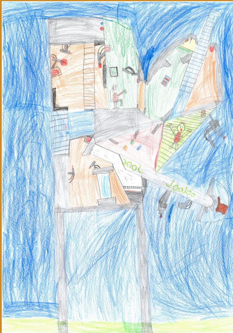
3. Platz: Jonas Ramstötter – „Spielroboter, macht auch Hausi“