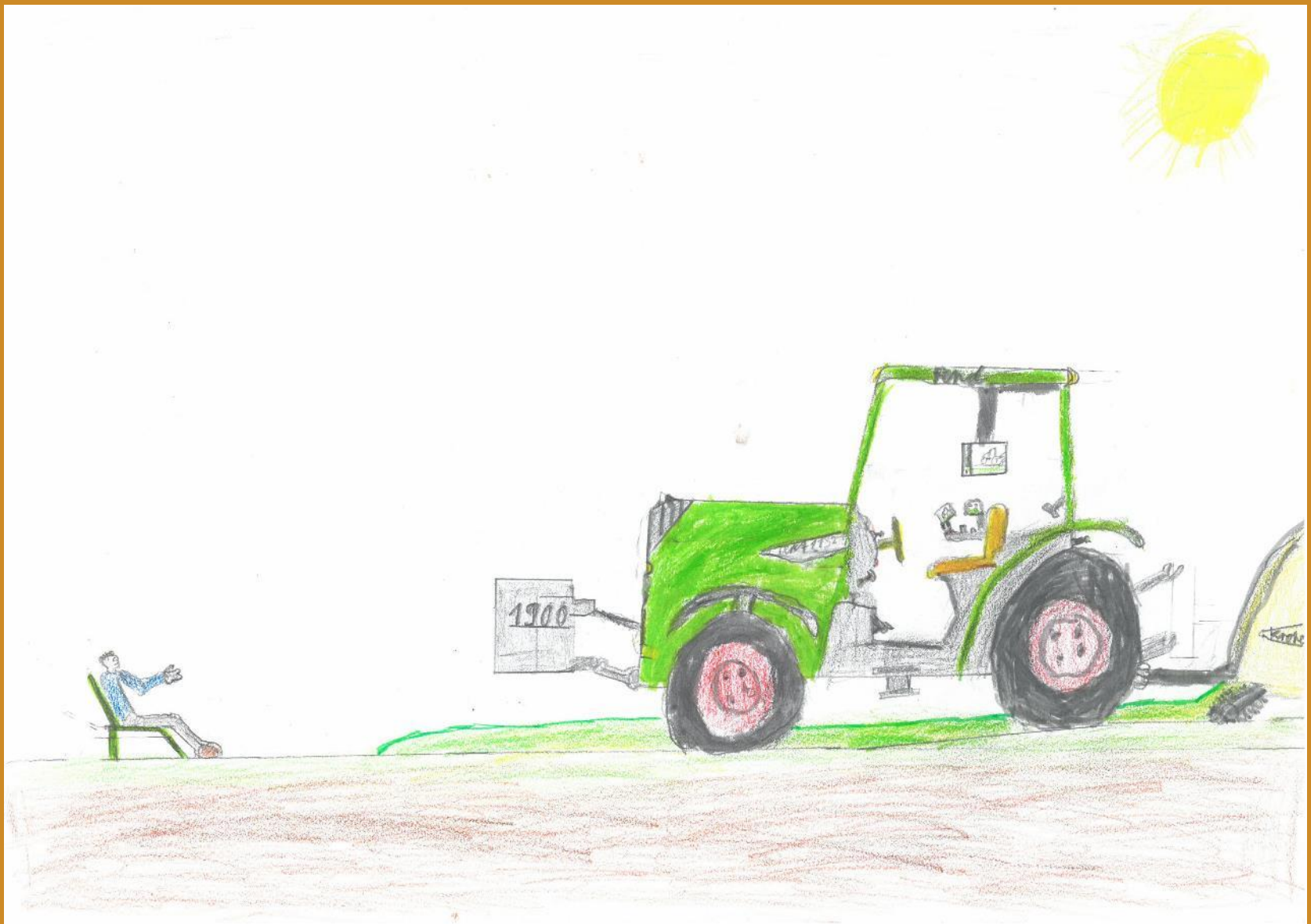
2. Platz: Matthias Junger – „Selbstfahrender Traktor“