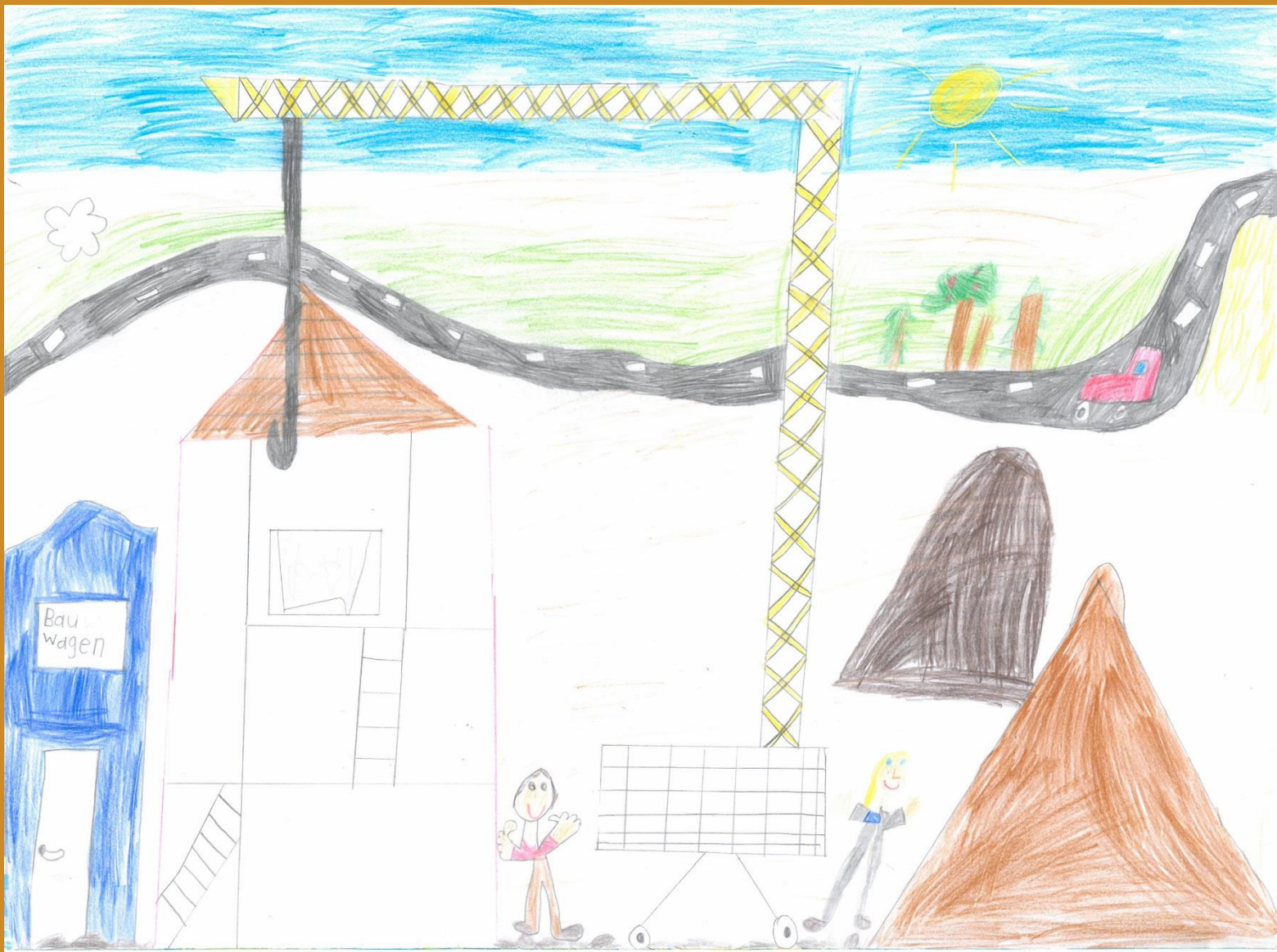
1. Platz: Julia Vordermayer - „Der Kran“