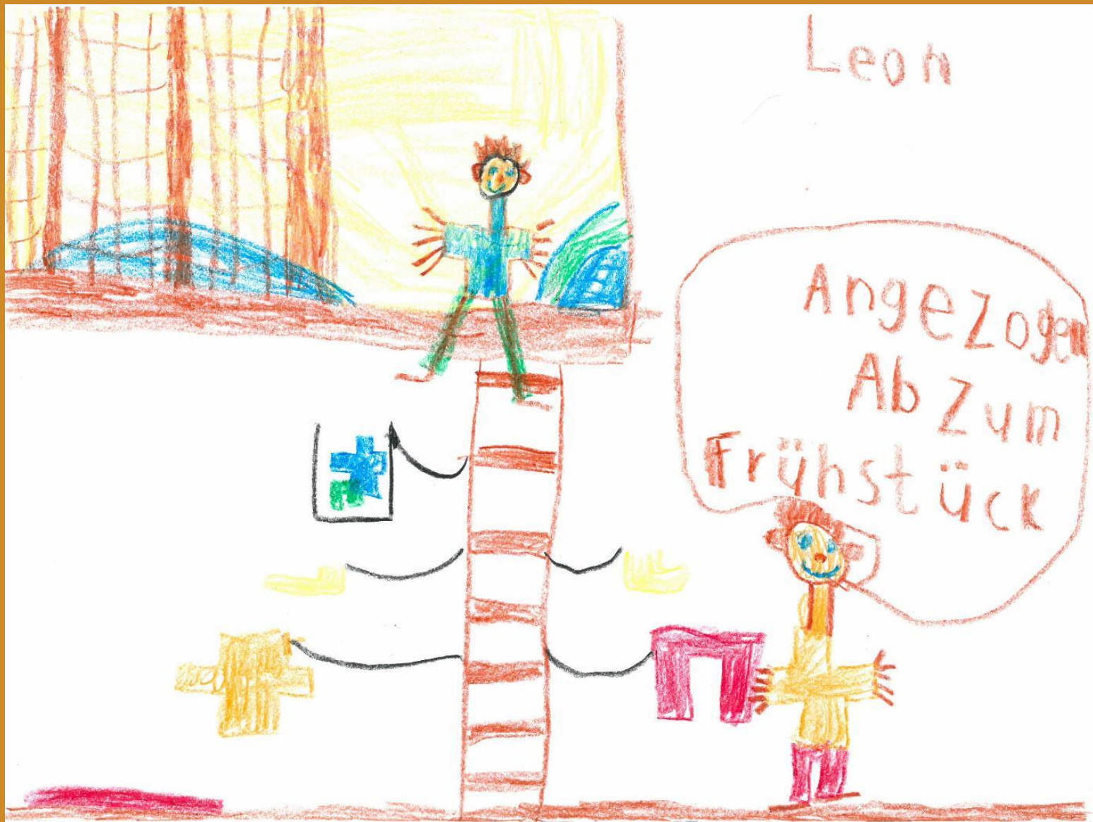
2. Platz: Leon Strecha - „Meine „Anziehmaschine“ am Morgen“