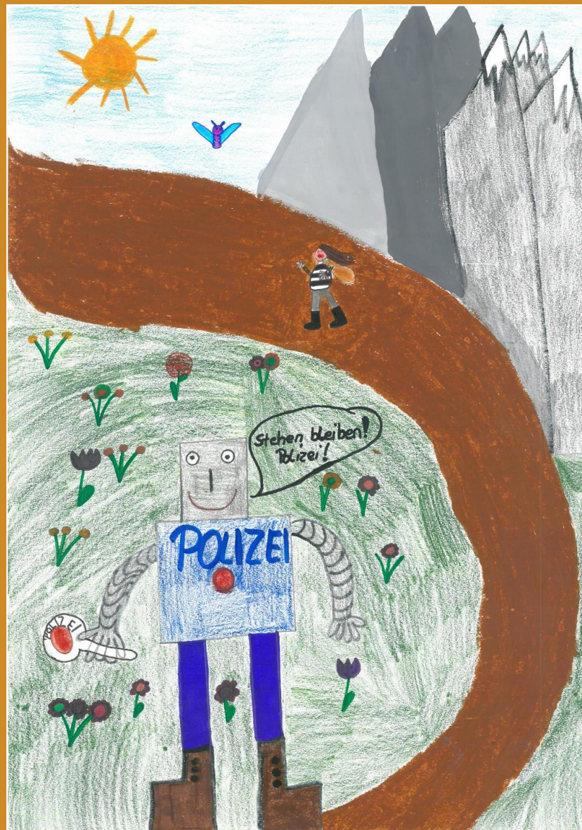
1. Platz: Paulina Hammann – „Polizeiroboter“