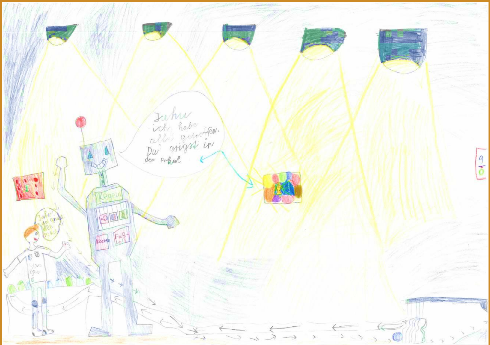
2. Platz: Florian Salzinger – „Der Kegelroboter gewinnt für mich“