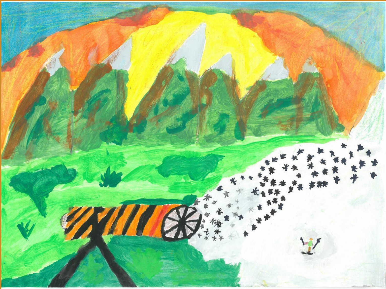
1. Platz: Simon Biffar – „Die coole Schneekanone“