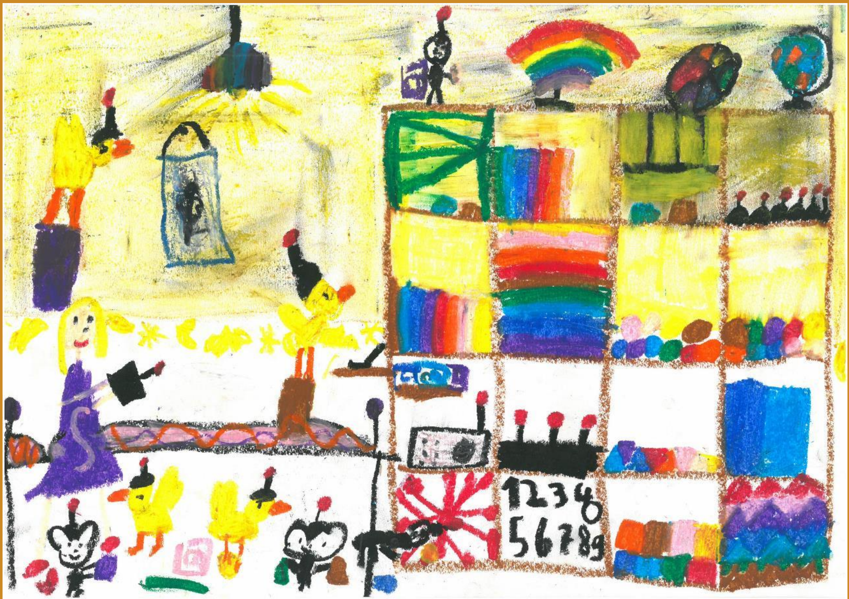
3. Platz: Sara Hauerdinger – „Mäuse und Vögel mit Kommandohüten“