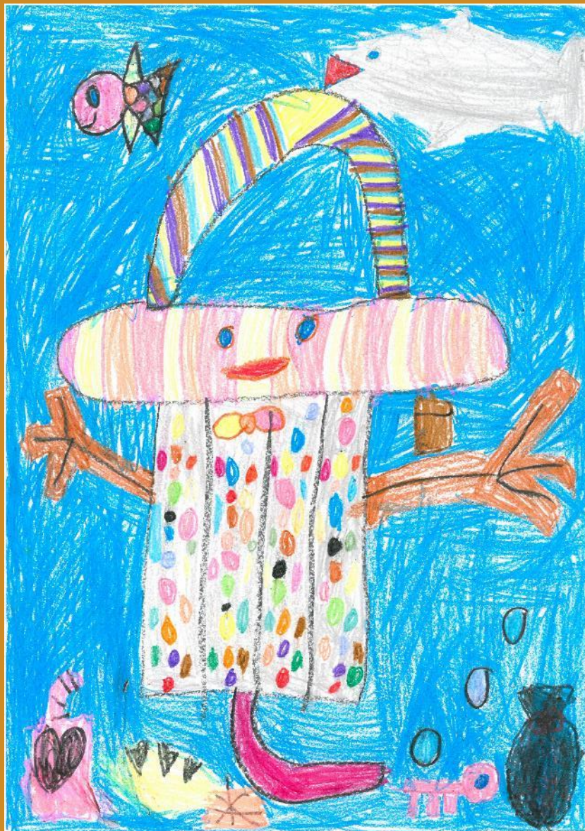
3. Platz: Janine Müller – „Mülleimer – Unterwasser - Sammler“