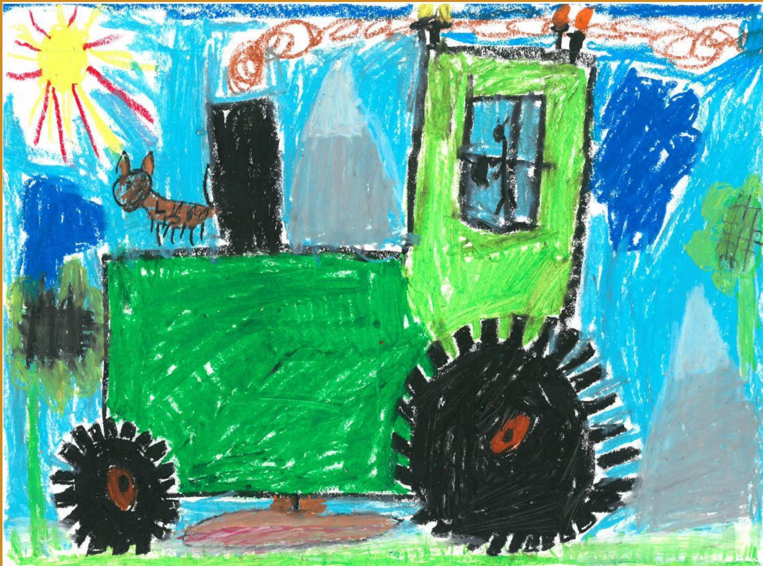
3. Platz: Valentin Glaser – „Der Bulldog mäht Rasen“