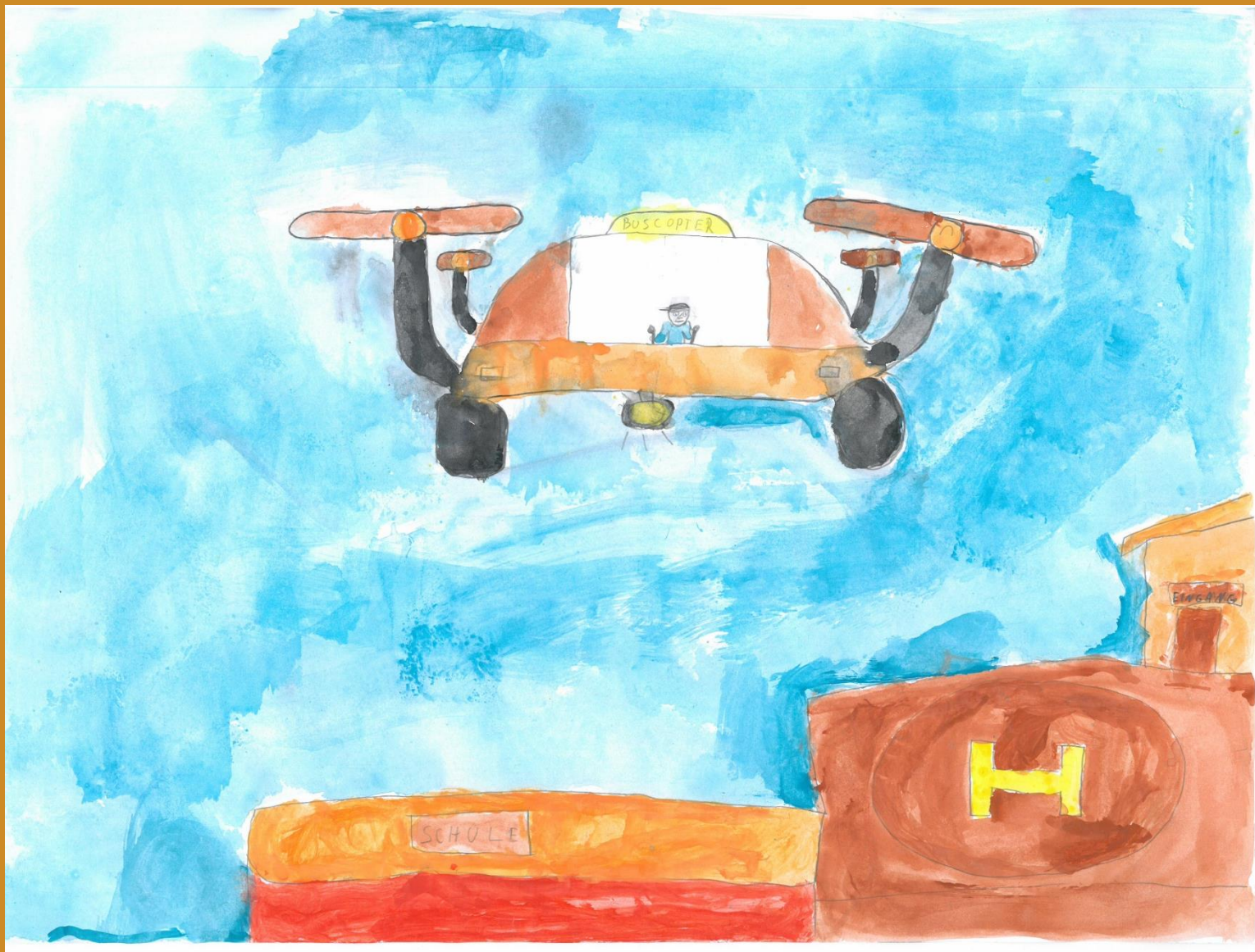
3. Platz: Antonio Krizan – „Buscopter“