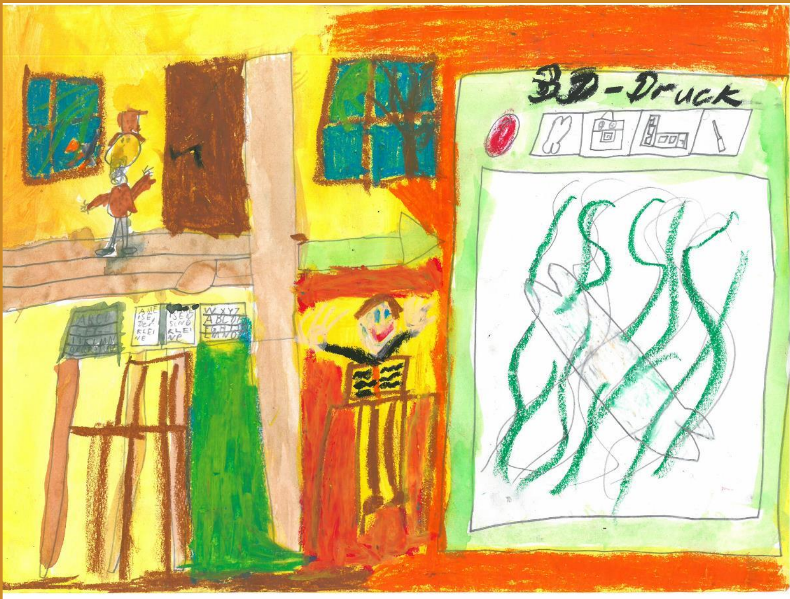
3. Platz: Korbinian Berger – „ Vom Buchdruck zum 3D - Druck“