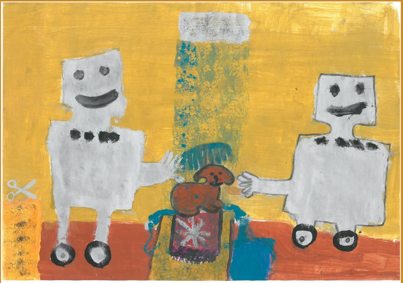
2. Platz: Milena Voraner – „Roboter zur Tierpflege“