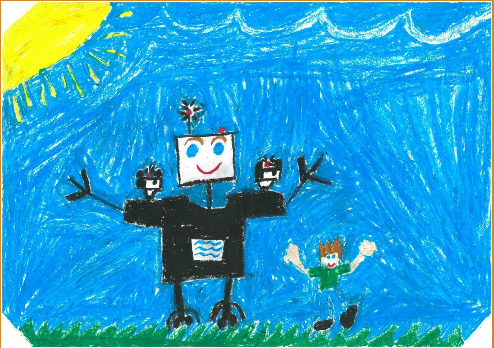
2. Platz: Armin Ranner – „Der coolste Roboter der Welt“