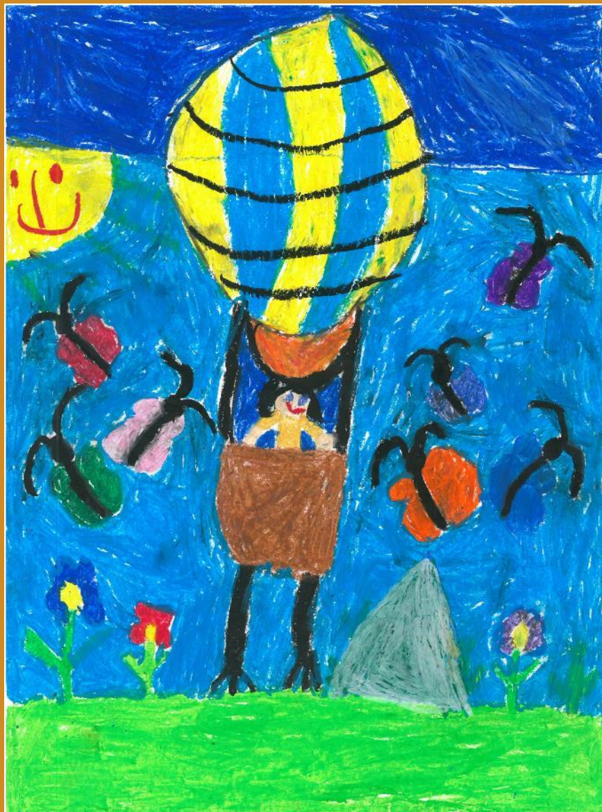
2. Platz: Antonia Rehrl – „Fußballon“