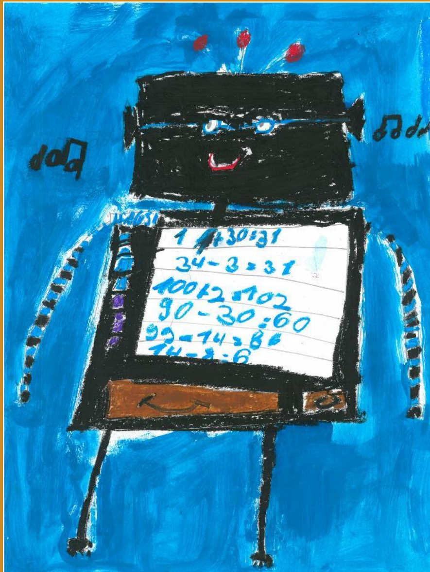
1. Platz: Madeleine Steinle – „Der Hausaufgabenroboter“