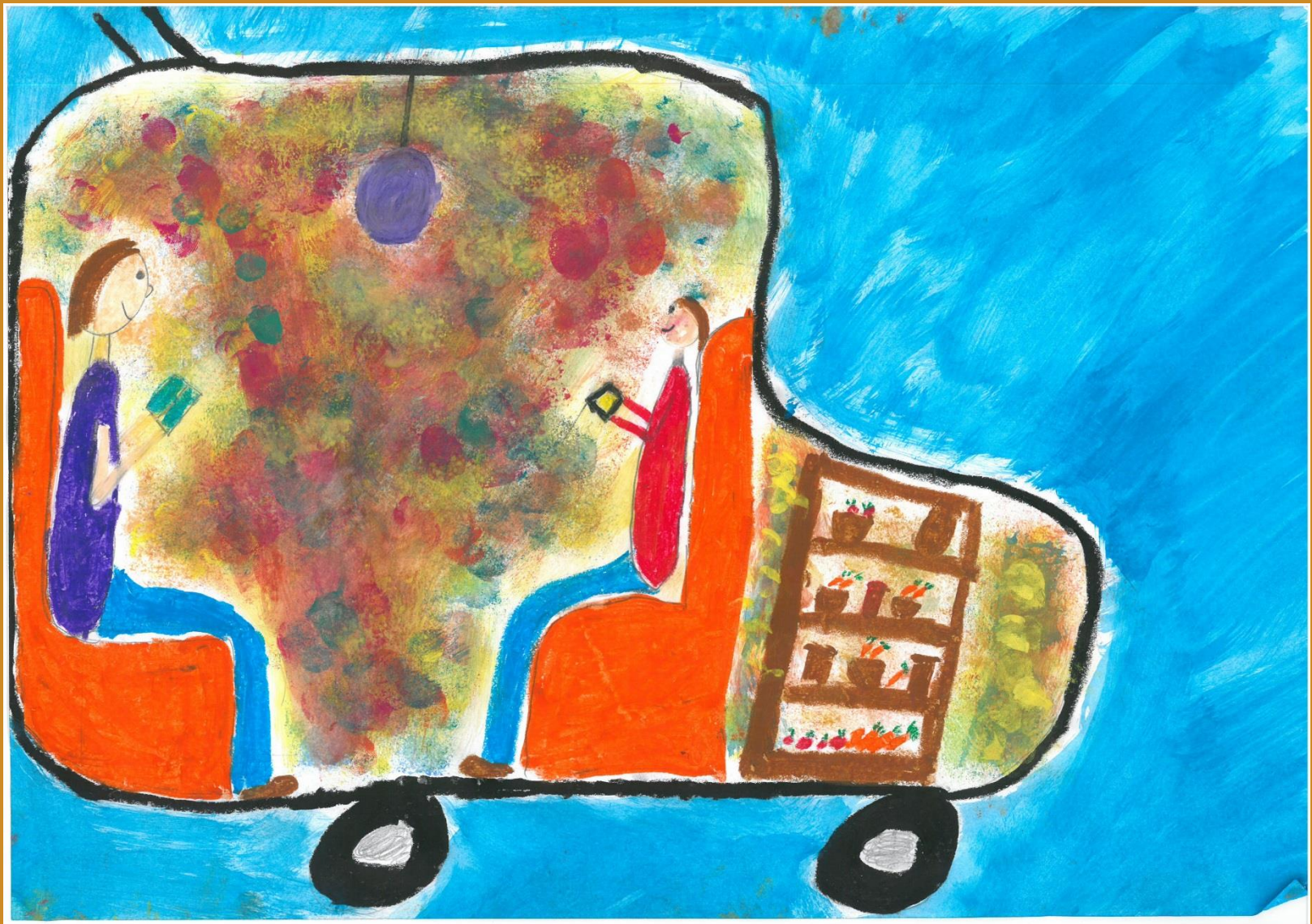
1. Platz: Anna Fuchs – „Ferngesteuertes Auto“