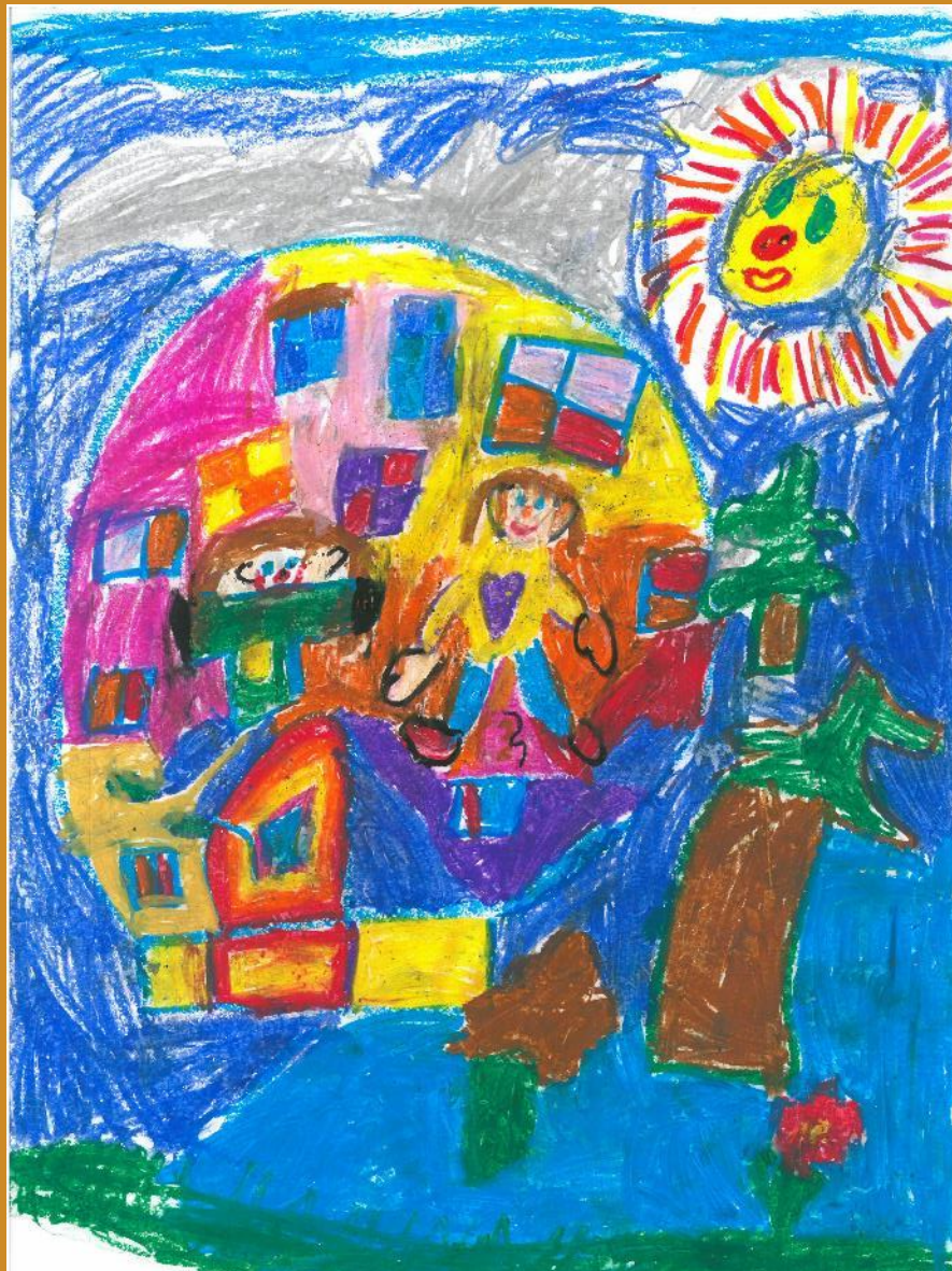
1. Platz: Eva Schwarz – „Seifenblasenfliegergerät für Menschen“