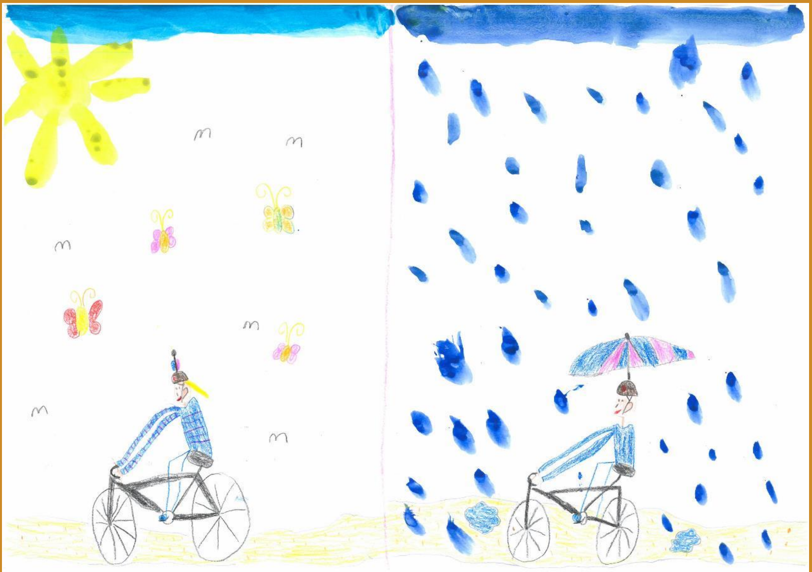
2. Platz: Lena Schirmer – „Trocken Fahrradfahren“