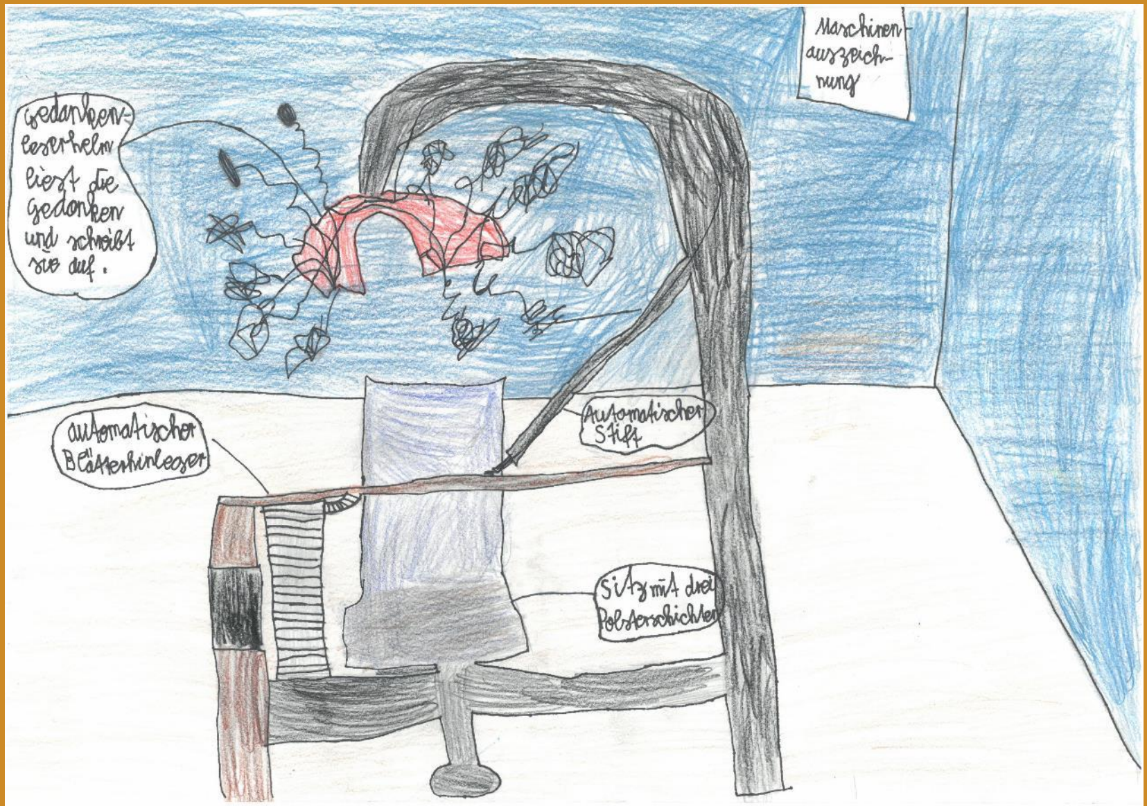
2. Platz: Mia Schmidt – „Der Gedankenleserschreibtisch“