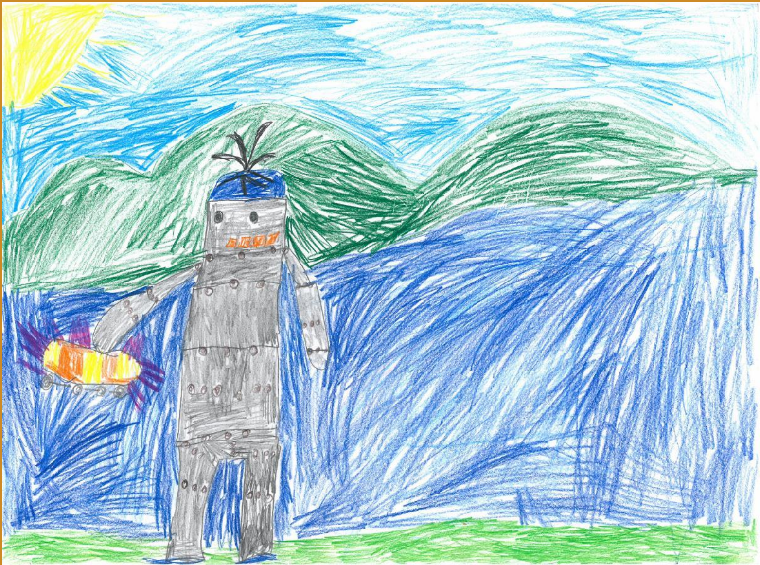
2. Platz: Carolina Betz - „Das Wasserboard“