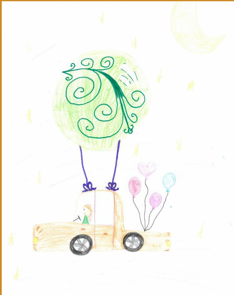
3. Platz: Amelie Hollnaicher – „Das fliegende Auto“