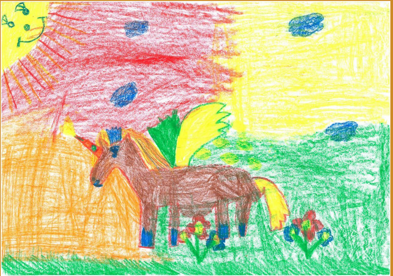
3. Platz: Alina Birnbacher - „Das fliegende Einhorn“