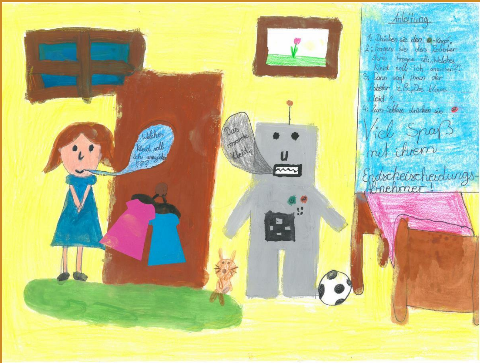
2. Platz: Julia Aicher – „Entscheidungsabnehmer“