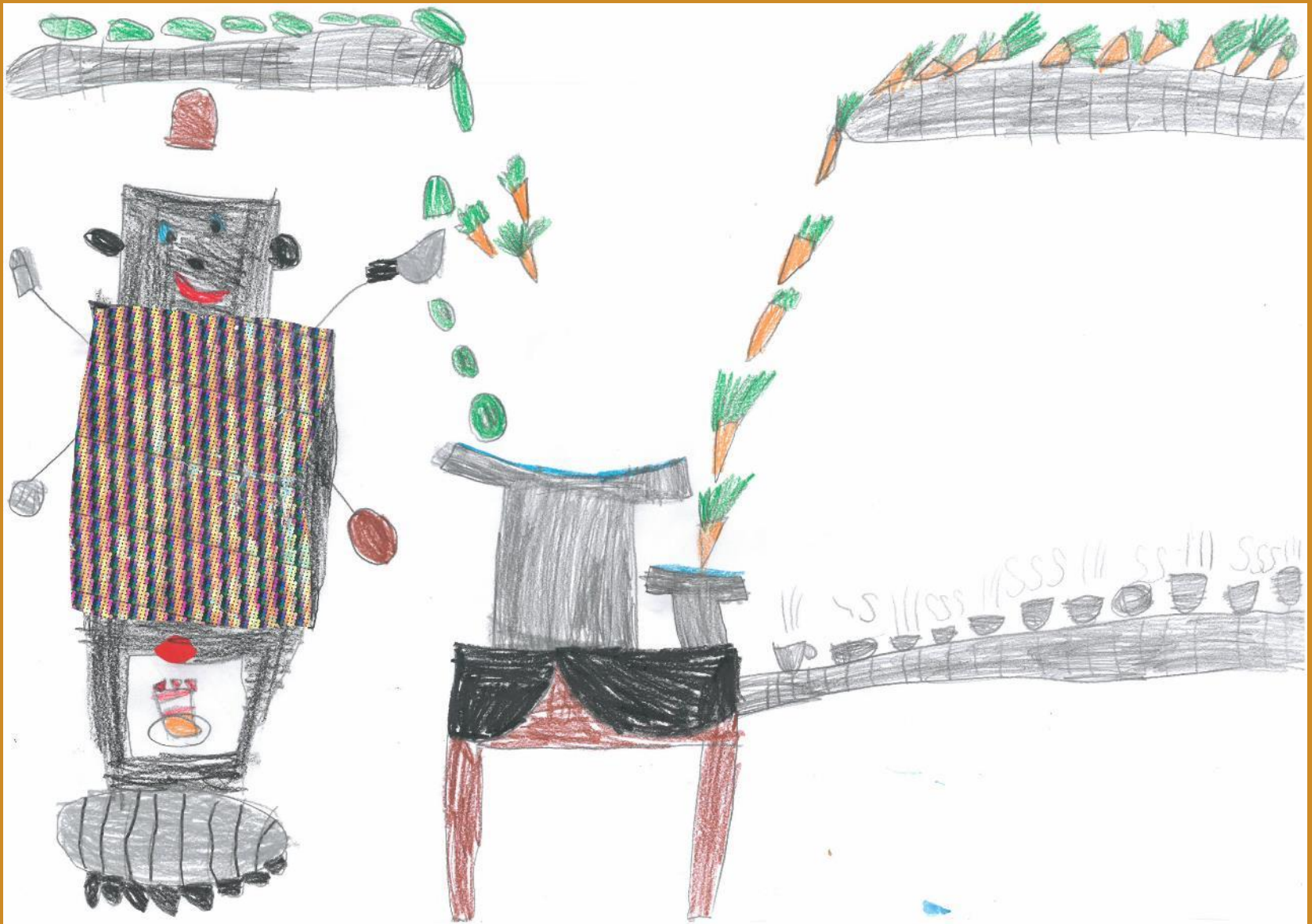
3. Platz: Mara Kruselburger – „Die Koch-Maschine“