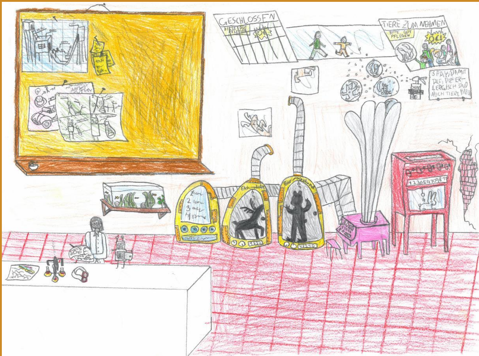
1. Platz: Maya Blieberger – „Im Labor“