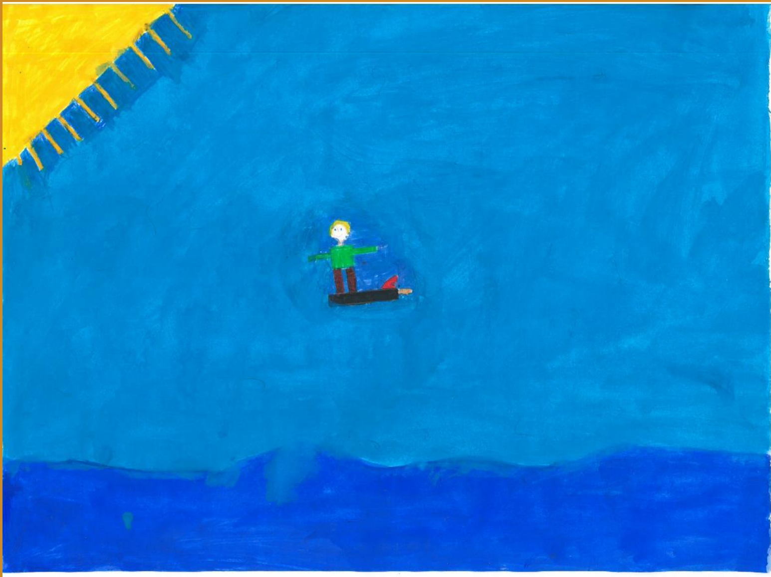
2. Platz: Fabian Grabner – „Das fliegende Brett“