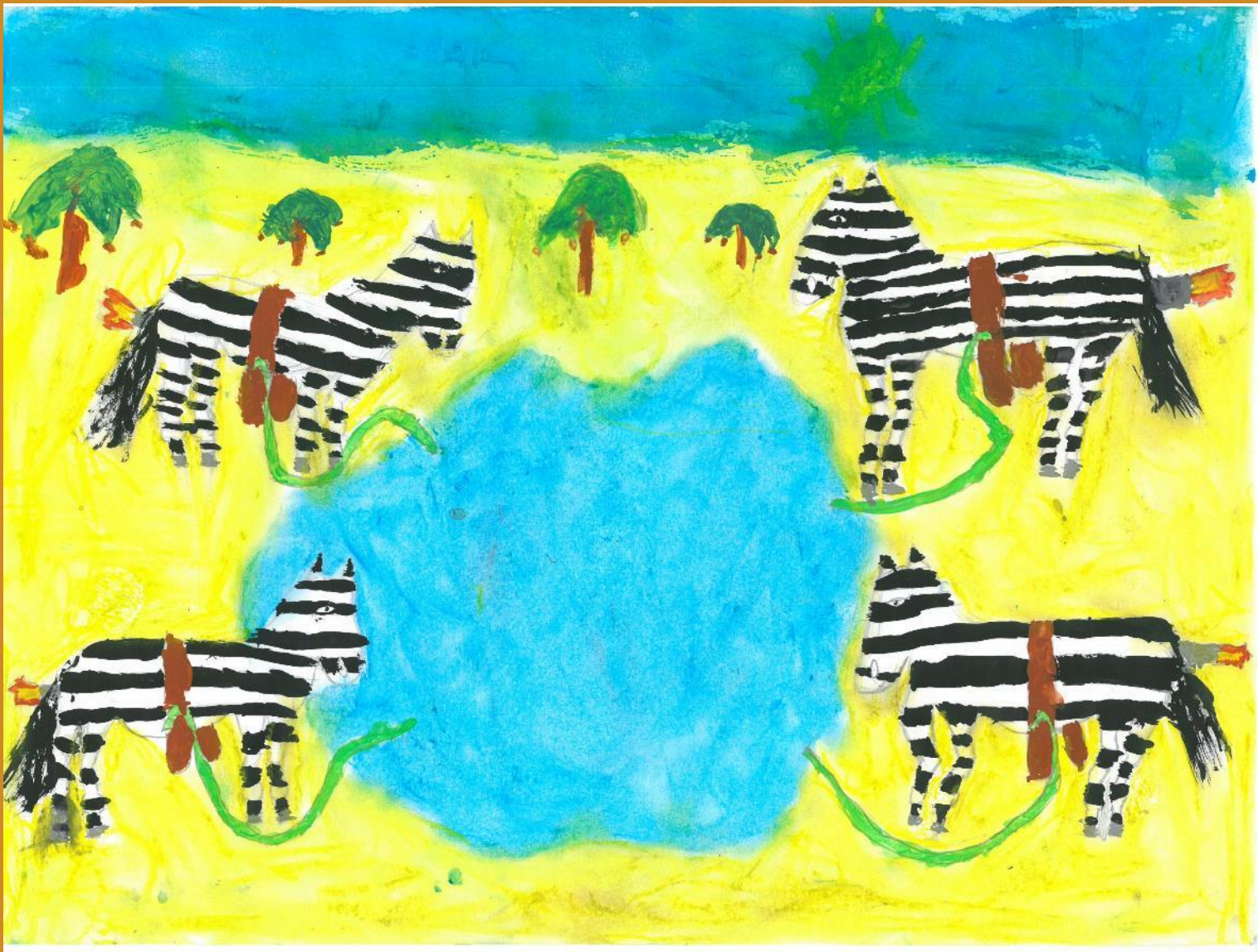
1. Platz: Leni Beer – „Afrikanische, wassertransportierende Zebras“