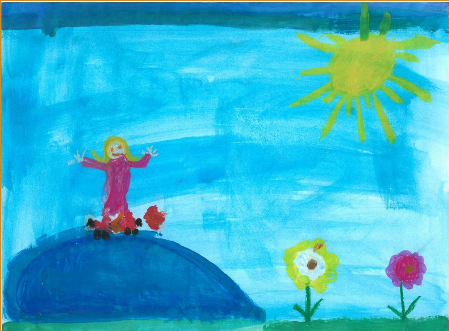
3. Platz: Diana Leitenbacher - „Inline-Skates mit Düsenantrieb“