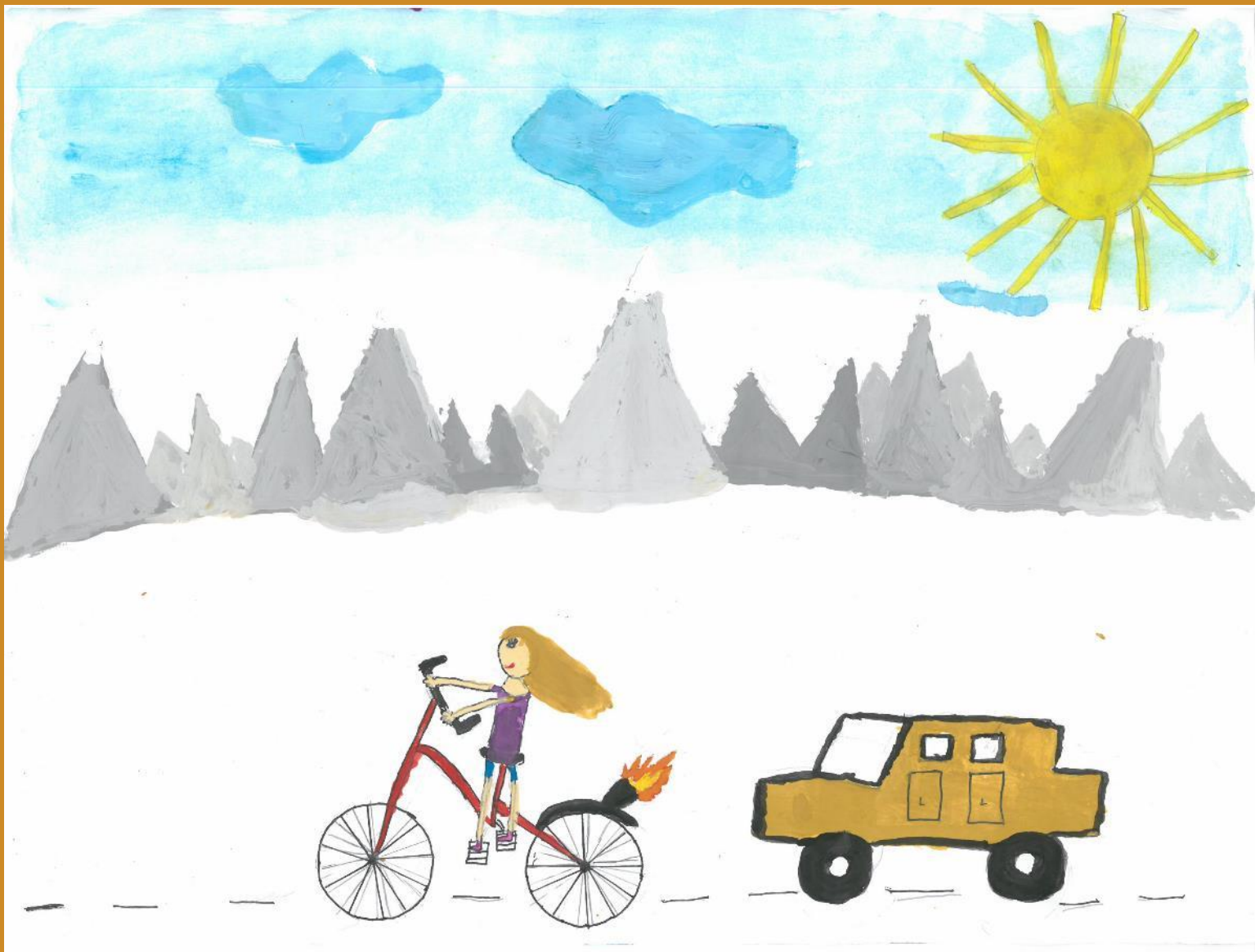
3. Platz: Marlena Stadler – „Einrad mit Düsenjet“