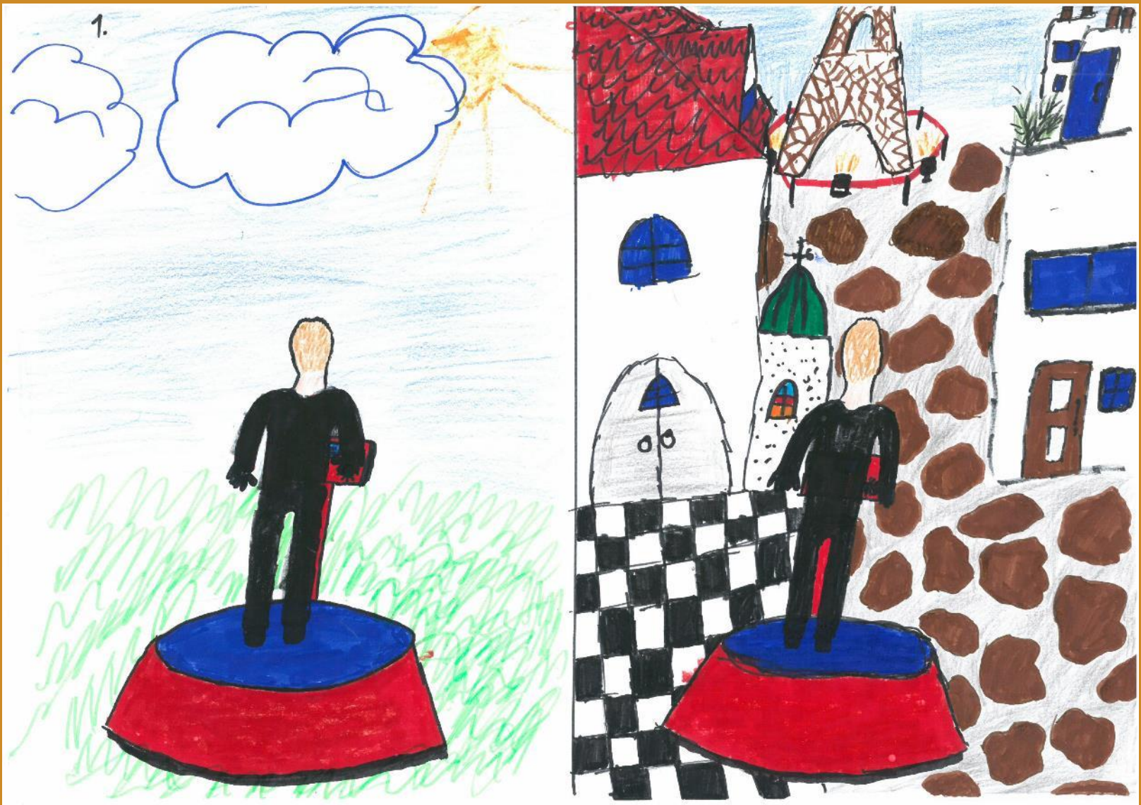
3. Platz: Finn Abfalter – „Der Teleporter“