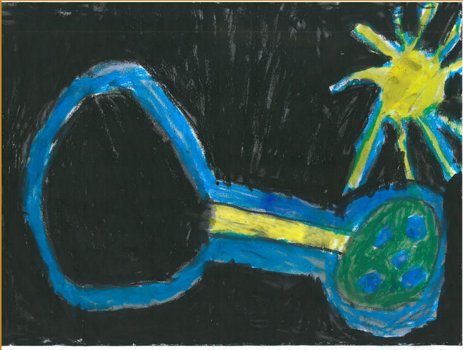
1. Platz: Michael Reiter – „Brücke ins Weltall“