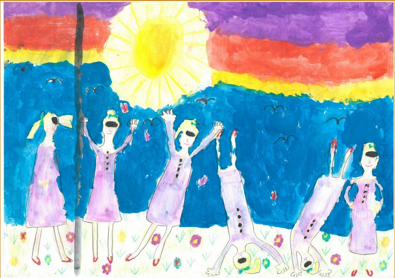
1. Platz: Sophia Abfalter – „Eine Brille, die in die Zukunft sieht“