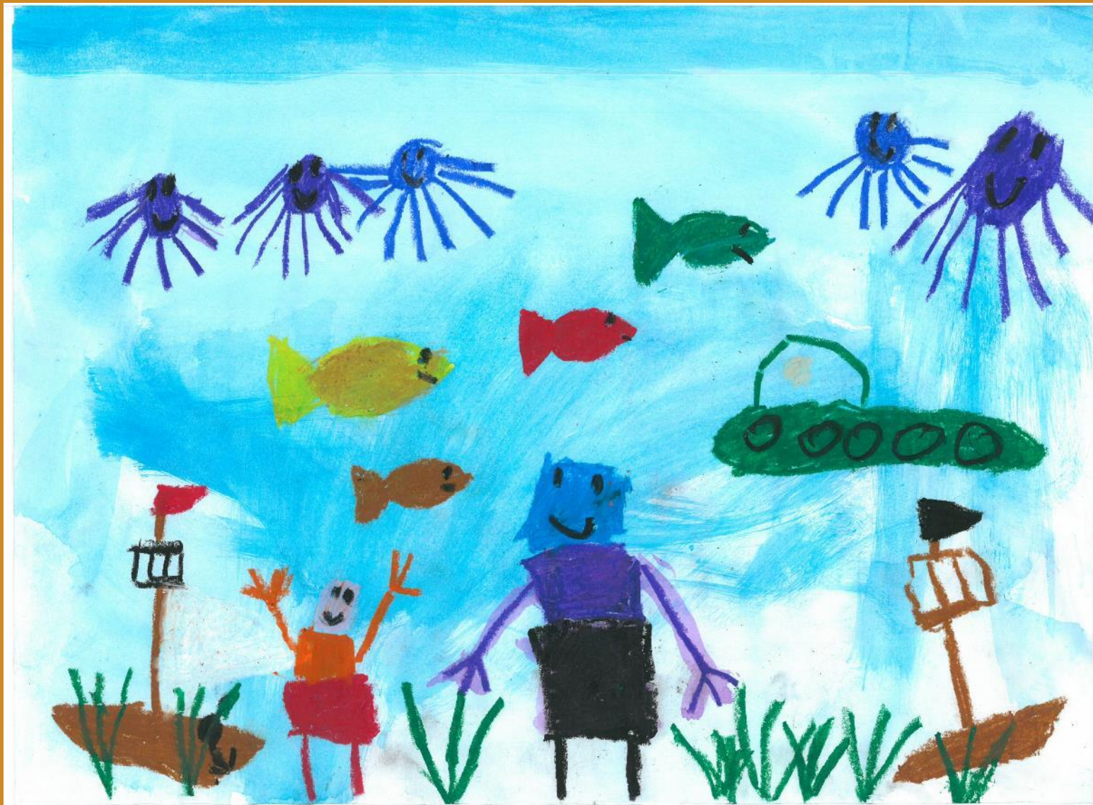
2. Platz: Sofia Weber - „Mein Unterwasserroboter“