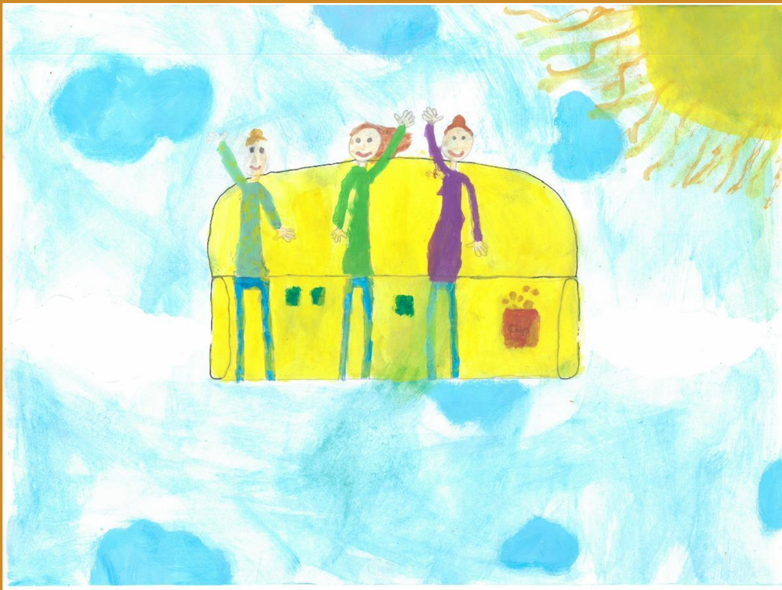
2. Platz: Elisa Dumberger – „Eine luftige Fahrt mit der fliegenden Couch“